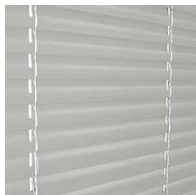
141 alu alt

(abgebildete Farbtöne sind nicht verbindlich und können vom Originalfarbton abweichen)